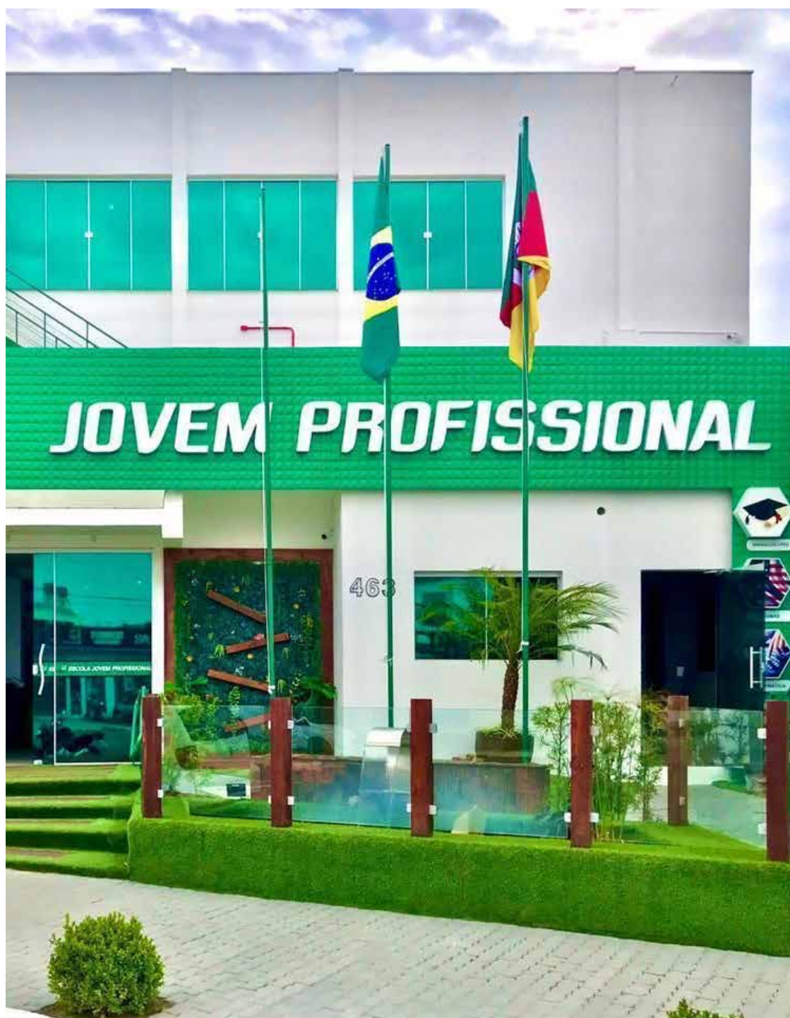
Faculdade Jovem Profissional atua em 27 capitais brasileiras e tem filial em Lisboa

Destaca ainda que todos os instrutores são maiores de idade e capacitados para ministrarem o curso. A direção da Jovem Profissional ainda resalta que dos 75 alunos, apenas um se sentiu prejudicado, sendo que outros três chegaram a fazer reclamação mas continuaram com a prática, e os outros 71 estudantes continuaram com as atividades normalmente.