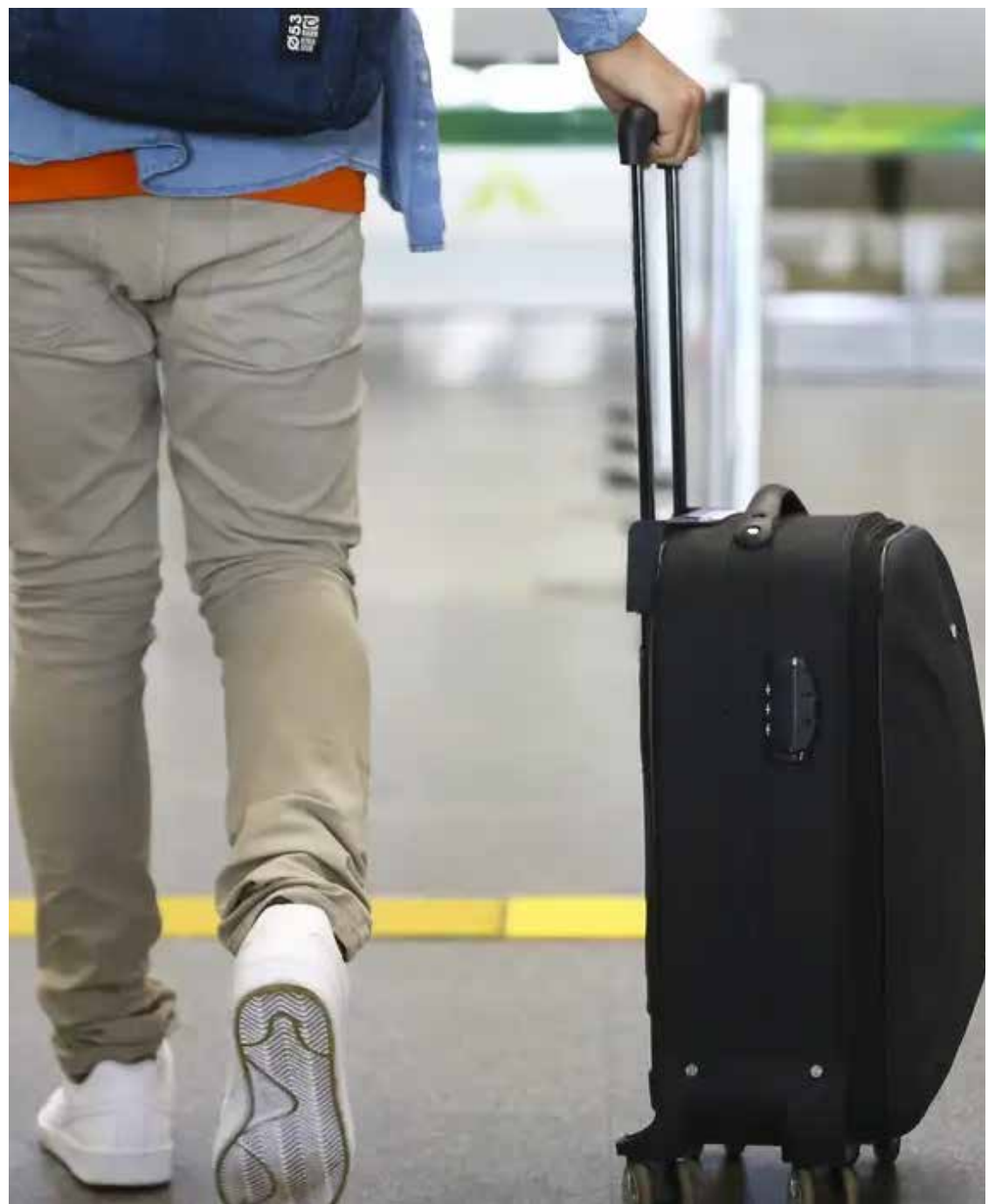
Viagens com crianças e adolescentes são submetidas a regras específicas visando à sua proteção integral

Crianças e adolescentes desacompanhados - Necessário portar autorização com firma reconhecida de ambos os genitores ou do responsável legal e/ou escritura pública. Crianças e adolescentes na companhia de pessoa maior - Autorização expressa pelos pais ou responsável legal, em documento particular com firma reconhecida.