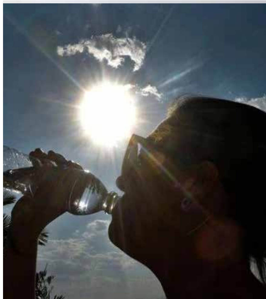
Quase metade das cidades brasileiras ficou em perigo potencial, com umidade do ar entre 20% e 30%