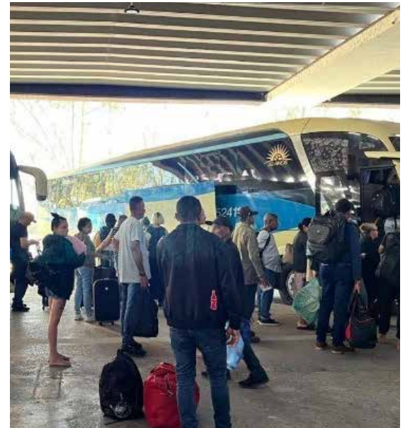
Ação ocorrerá no Terminal Rodoviário Engenheiro Cássio Veiga de Sá, em Cuiabá, das 8h às 18h