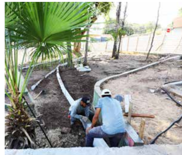
Até o momento, 100% das obras de demolição e remoção das antigas calçadas, que estavam danificadas e inutilizadas, já foram concluídas

A Prefeitura de Cuiabá já revitalizou as praças Alencastro, República, Ipiranga, Bispo Dom José, Senhor dos Pássaros, Alberto Novis, Caetano Albuquerque, Praça da Mandioca, MISC (Museu da Imagem e do Som Cuiabano), Casa Barão de Melgaço, fachada da Casa de Bem-Bem, escadaria do Morro Alto, escadaria do Beco Alto e Praça Santos do Morro, além de intervenções no Beco do Candeeiro e na Praça Santos Dumont.