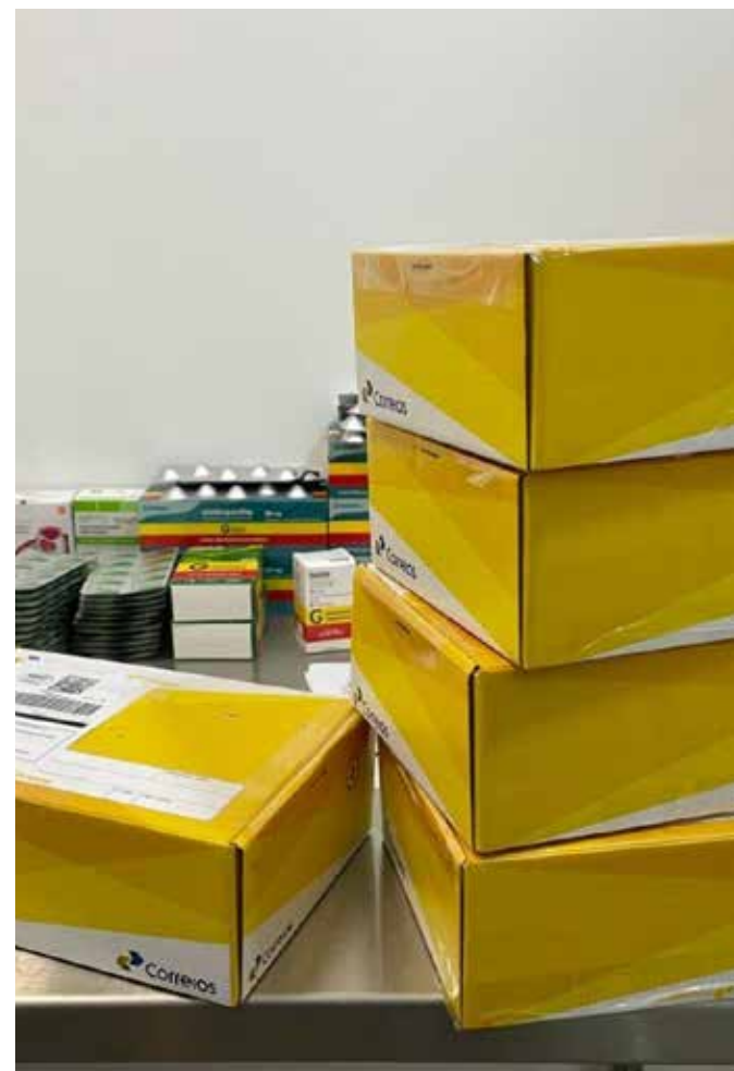
No Estado, mais de 2.500 pessoas de 23 municípios estão cadastradas no programa Remédio em Casa

São feitas três tentativas de entrega. Caso a entrega não seja viável, o paciente poderá fazer a retirada na Farmácia Estadual.