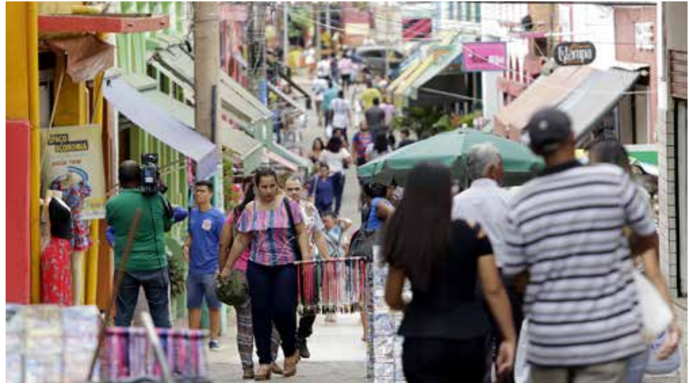
A população residente na capital mato-grossense chegou a 682.932 pessoas. Essa quantidade representa um aumento de 4,91%

Já o menor município de Mato Grosso, Araguainha, a 471 km de Cuiabá, perdeu 4 moradores em um ano e está entre as quatro menores do Brasil. A população do município soma 1.006 habitantes, sendo maior apenas que Serra da Saudade (MG), com 854 moradores, Anhanguera (GO), com 921, e Borá (SP), com 928.