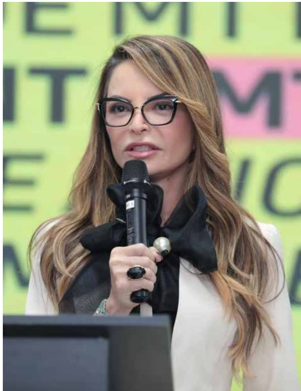
Primeira-dama Virginia Mendes alerta de que as leis sobre os abusadores e agressores devem mudar

Judiciária Civil (PJC), onde também foi instalada a Casa de Eurídice, com atendimentos 24 horas online às vítimas de violência doméstica.