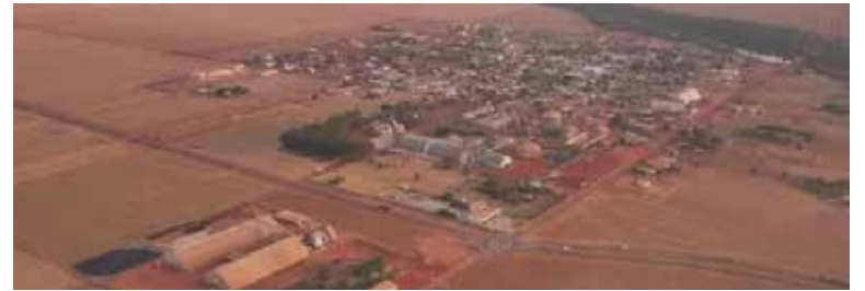
A localidade conta com uma população de nove mil habitantes e, atualmente, o eleitorado é de 3.485 pessoas

Por enquanto, a cidade tem mais plantações do que casas, são lavouras a perder de vista.