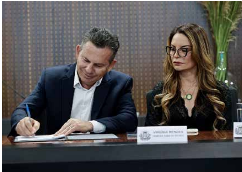
Governador Mauro Mendes e a primeira-dama Virginia Mendes