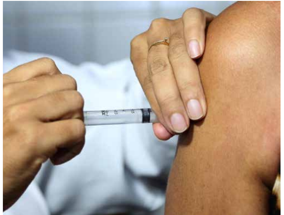
Até o momento, foram aplicadas 16.938 da primeira e apenas 1.624 da segunda dose em Mato Grosso