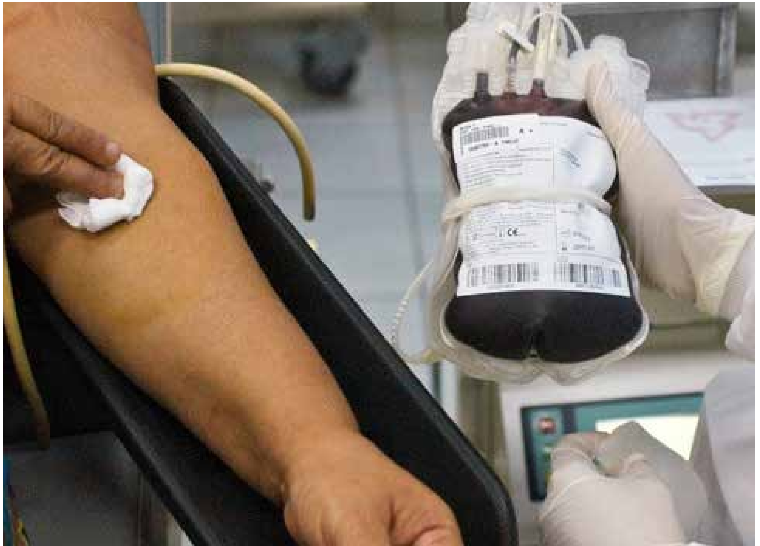
O banco de sangue funciona regularmente de segunda a sexta-feira, de 7h30 às 18h, e fornece o atestado de comparecimento ao doado

O sangue é uma mistura de várias células que se renovam e estão suspensas em um líquido chamado plasma. É ele que leva o oxigênio e nutrientes para todos os tecidos e órgãos do corpo humano. Além de também transportar os hormônios pelo organismo e retirar dos tecidos as sobras das atividades celulares. Ou seja, ele é essencial para a nossa sobrevivência.