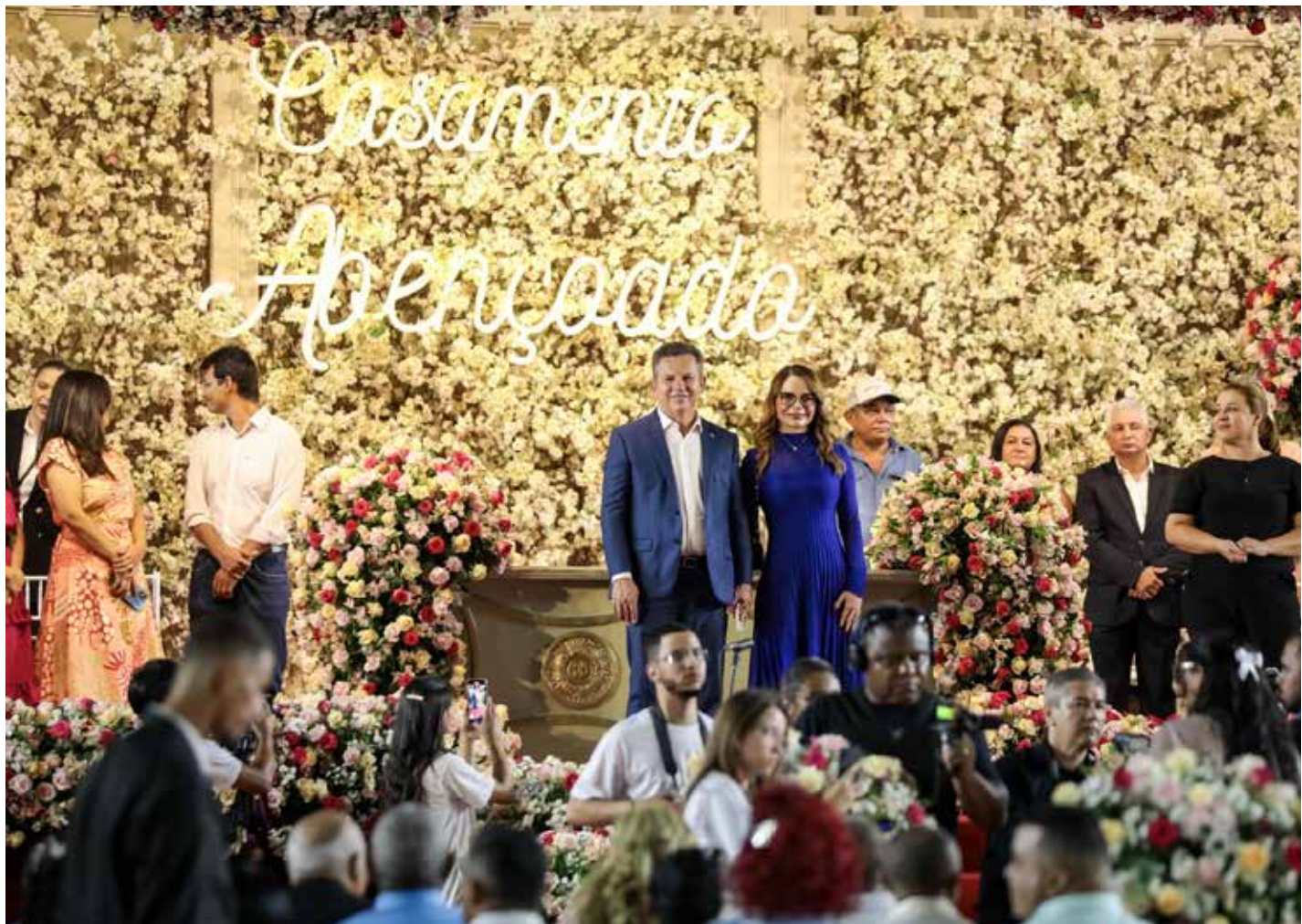
“Estou muito feliz por estar, mais uma vez, organizando este grande evento que celebra o amor”, destacou a primeira-dama Virginia Mendes

A iniciativa atende a todas as religiões, pessoas com deficiência e hipossuficientes, com renda total de até três salários mínimos e cadastrados no CadÚnico. Para os casais de Cuiabá, as inscrições devem ser feitas na sede da Setasc, localizada na Rua Jornalista Amaro de Figueiredo Falcão, nº 503, no bairro CPA I. Já os casais de outros municípios contemplados devem se inscrever nos Centros de Referência de Assistência Social (CRAS).