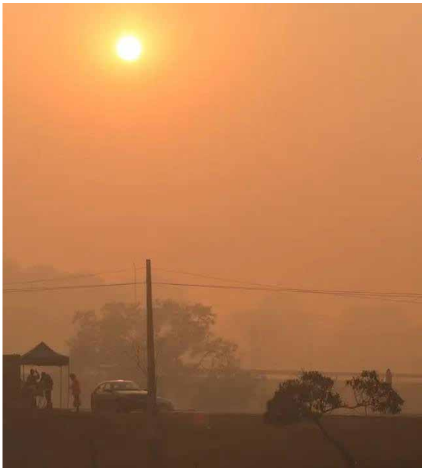
Um exemplo é a sequência de ondas de calor neste ano no Brasil. Já é a oitava, com variações que vão de cinco a dez graus acima da média em Mato Grosso