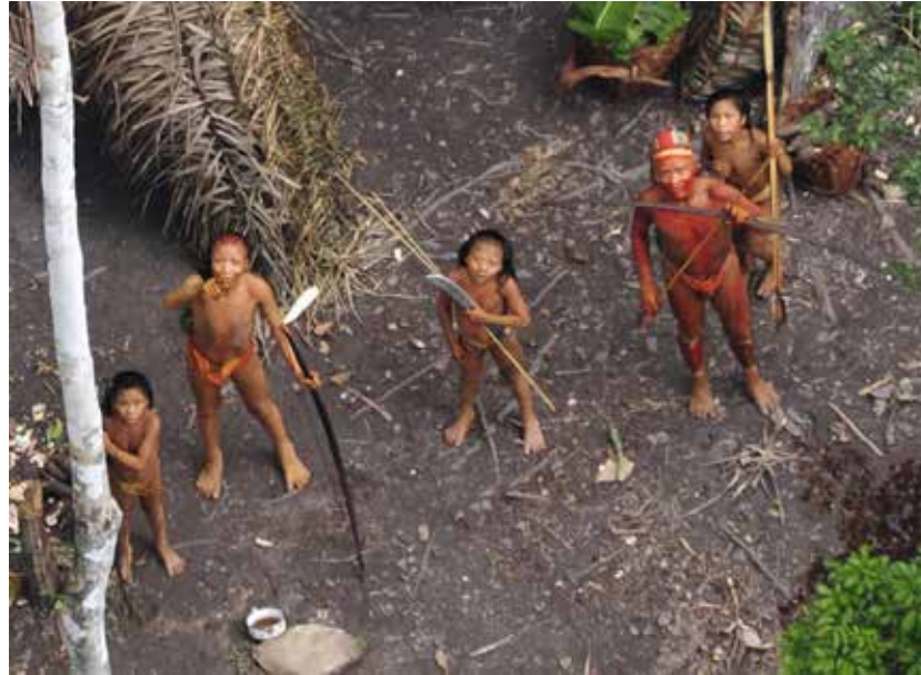
Um grupo de indígenas isolados no Brasil visto do ar durante uma expedição do governo brasileiro