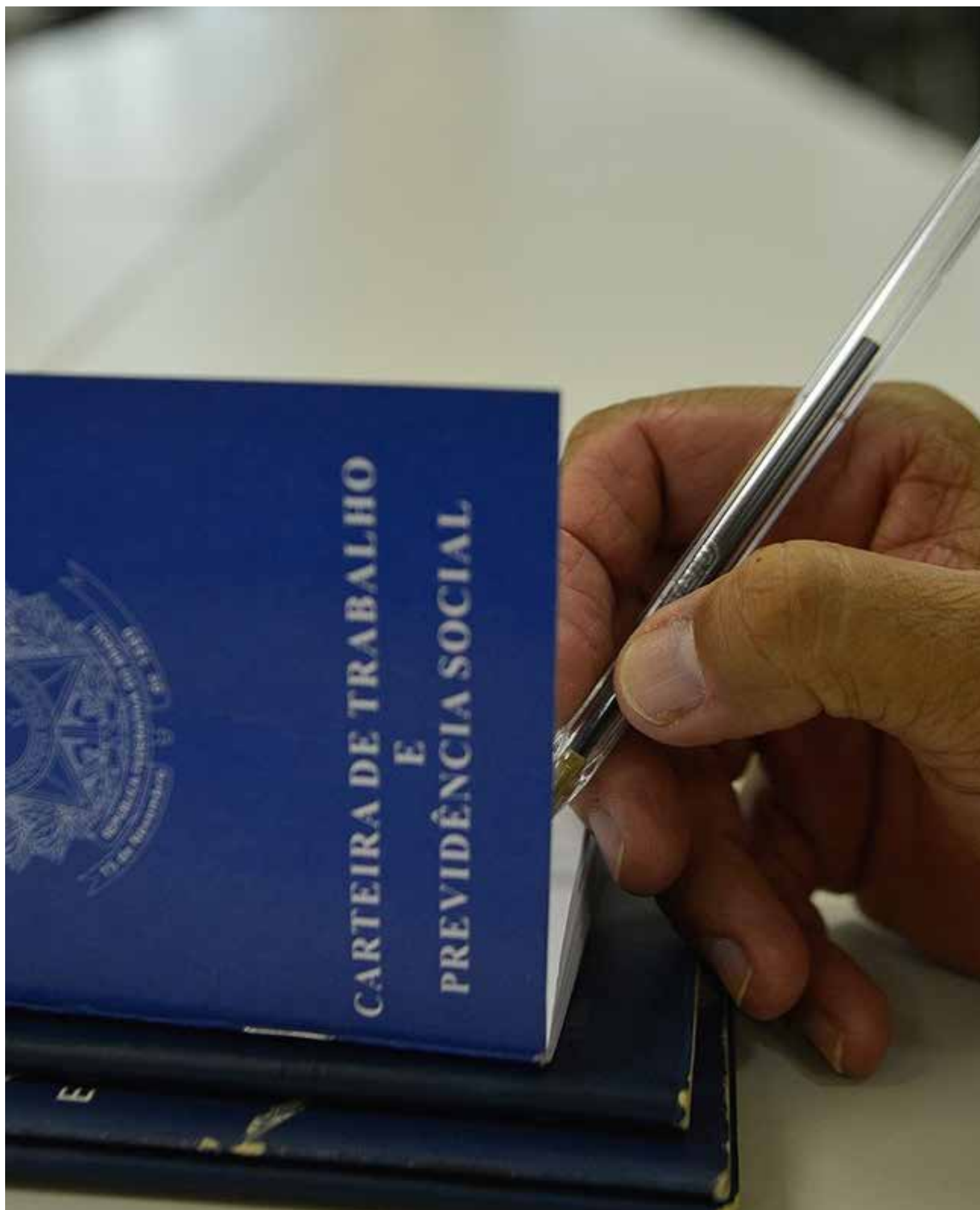
Setor de serviços foi principal responsável pela geração de vagas em Mato Grosso

“Os dados do Caged constatarem que o Estado se destaca em diversos setores, como Agropecuária, Construção Civil, Comércio e a Indústria. Na atual gestão, Mato Grosso se transformou em um excelente ambiente de negócios que atraem diversas empresas e que gera cada vez mais novos empregos e renda para a população. Nenhum lugar no Brasil cresce como nós”, afirma o secretário.