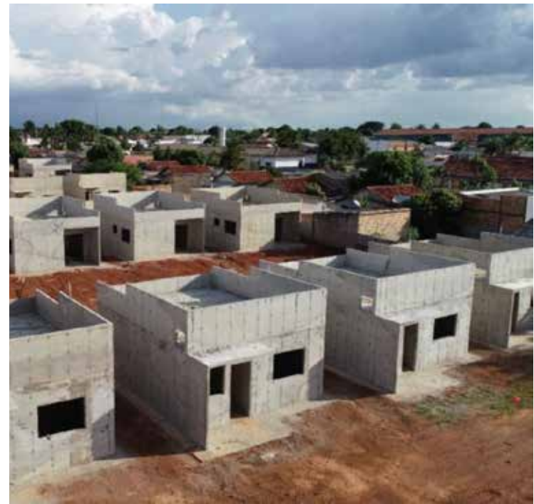
A empresa vencedora do edital receberá a concessão de uso da área para a construção de moradias enquadradas nos programas habitacionais SER Família Habitação