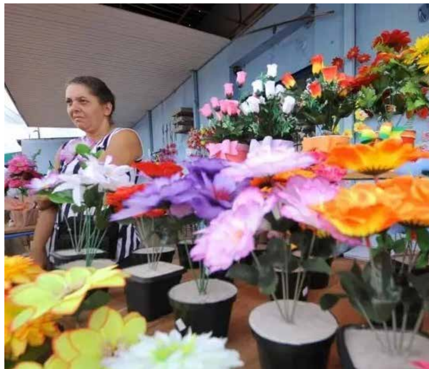
As flores demonstram o afeto e carinho para os mortos. As plantas também representam um recomeço, uma vida nova