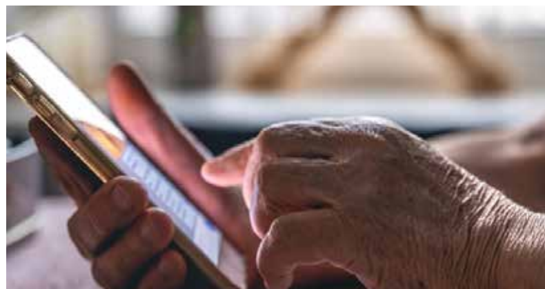
O drama vivido por brasileiros em extrema vulnerabilidade econômica, intelectual e tecnológica, atinge um número cada vez maior de pessoas a cada ano

O golpe aconteceu em junho e ela só nos procurou em setembro, logo, as providências não tem muita eficácia. Até conseguirmos uma decisão favorável e urgente na Justiça, o pagamento será debitado automaticamente da conta dela”, explica.