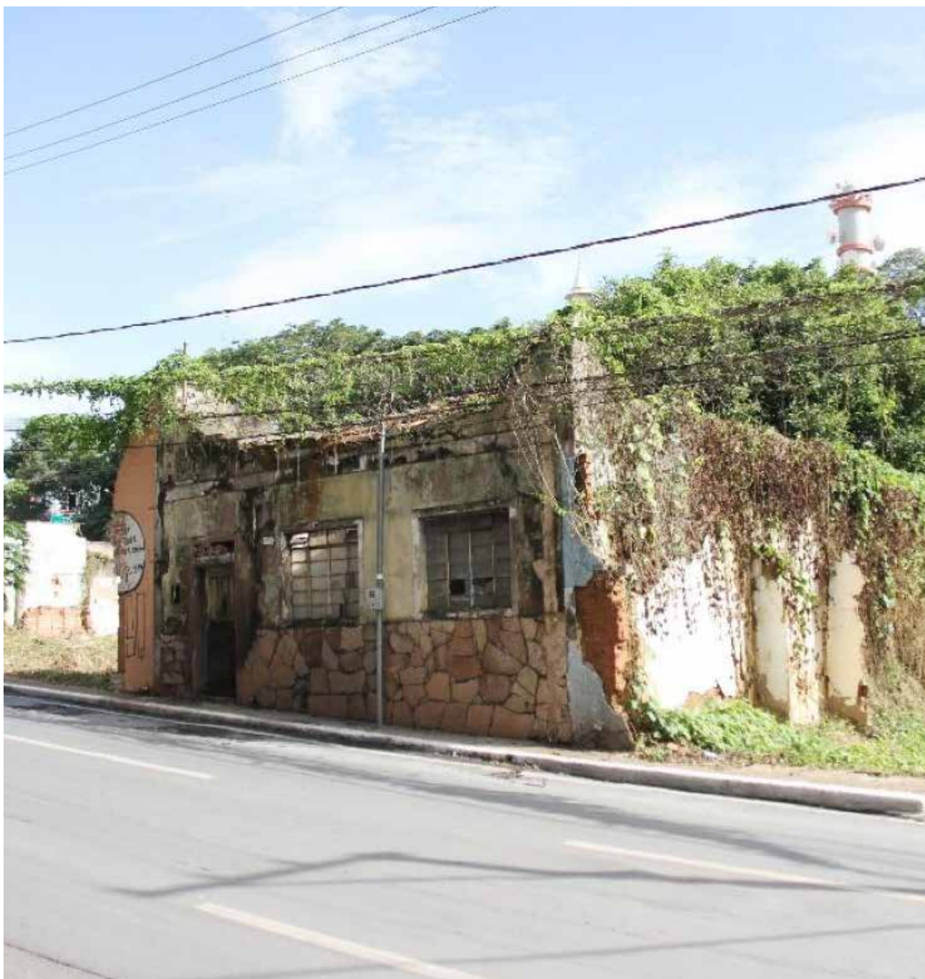
A casa, registrada sob a matrícula nº 29.755, foi desapropriada pelo Estado para a execução de obras do VLT, mas o valor oferecido originalmente não foi aceito pelo proprietário

A conciliação foi conduzida pelo Centro Judiciário de Solução de Conflitos e Cidadania da Fazenda Pública (CEJUSC) e resultou na determinação de pagar de R$ 363.415,09 como indenização, valor dividido igualmente entre os irmãos. Com o pagamento, o Estado assumiu a posse definitiva do imóvel.