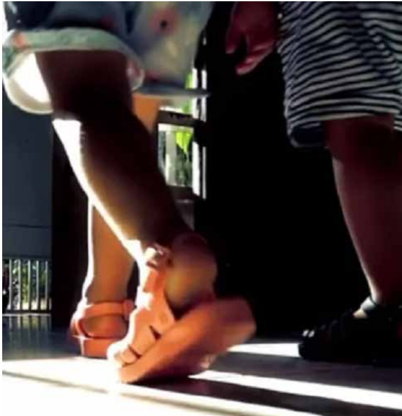
Os dados consolidados do levantamento dos Cartórios de Registro Civil apontam que a Covid-19 deixou, desde 2019, 679 crianças órfãos de pelo menos um de seus pais em MT

Quando consideradas apenas crianças e adolescentes que ficaram órfãos dos dois pais, os números variam. Em 2021 foram 33, em 2022, 31, em 2023, 35 e, em até outubro de 2024, 19 órfãos. Em razão de seu contingente populacional, São Paulo é o estado que mais registra órfãos no Brasil, seguido pela Bahia, Rio de Janeiro e Minas Gerais.