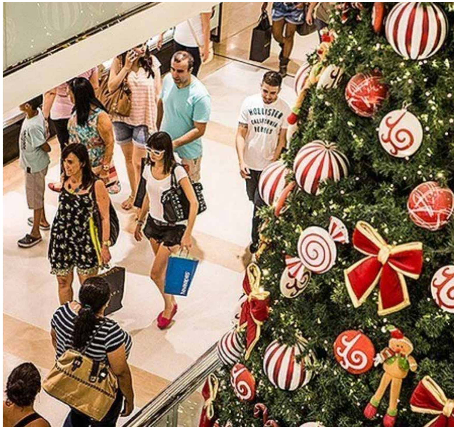
As lojas nos centros das cidades serão as mais buscadas pelos compradores, principalmente na véspera de Natal

Entre as formas de pagamento, a principal é o cartão de crédito com 60%, seguido pelo Pix, que somou 21,6%. Já dinheiro e cartão de débito representam 6,6% e 6%, respectivamente. A maioria (33,8%) dos que pretendem consumir afirmaram que gastarão menos, tanto é que se observou um recuo de 14,6% no gasto médio entre o Natal deste ano com o do ano passado.