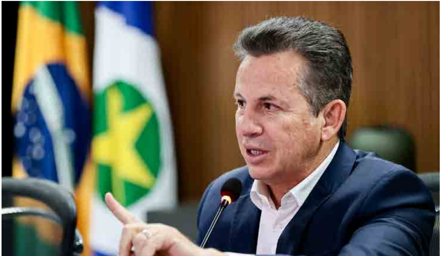
Mauro Mendes participou da abertura da Semana Pedagógica em Mato Grosso, onde comemorou os avanços no setor educacional