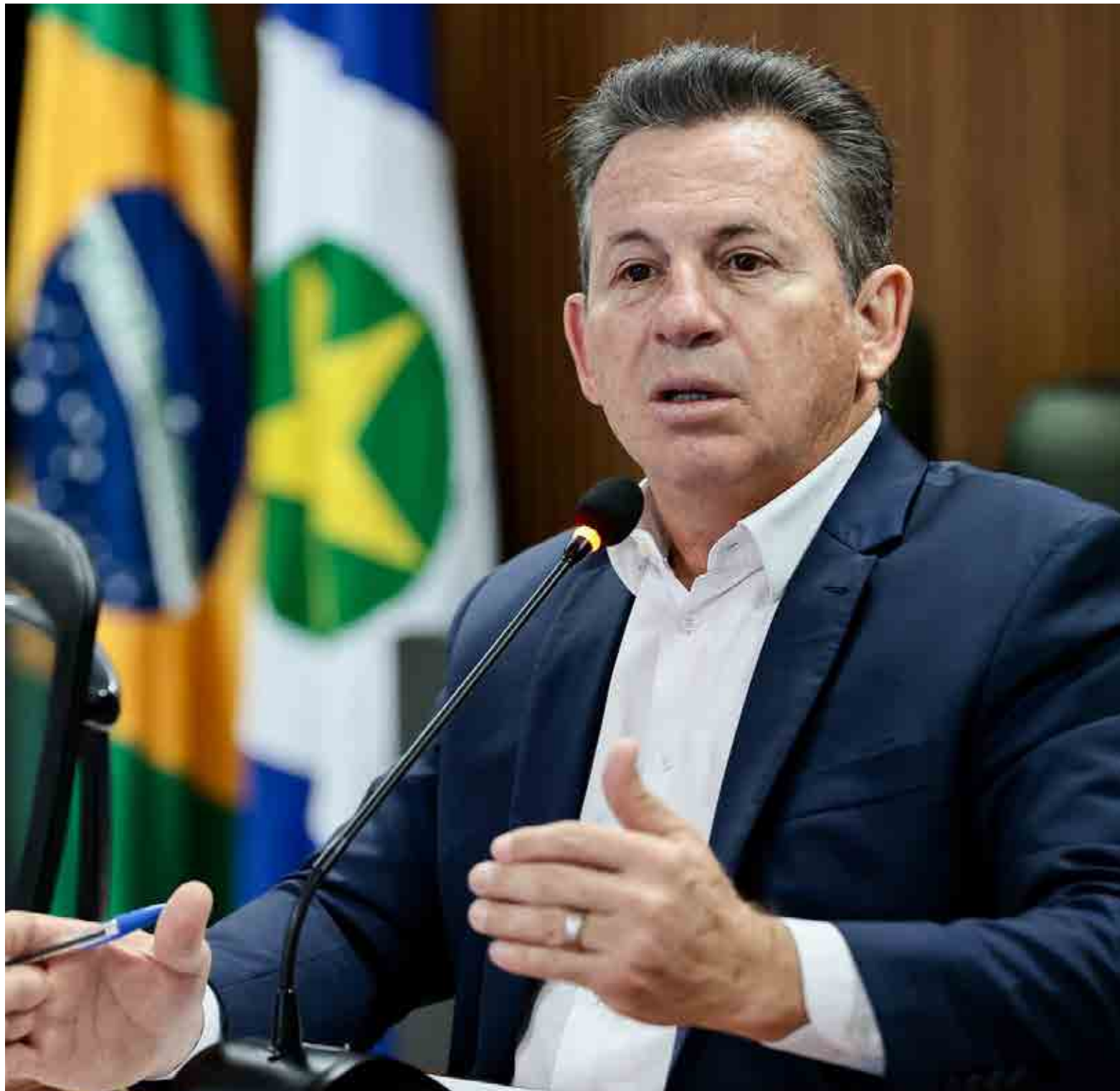
Mauro Mendes: “Cada vez mais, Mato Grosso tem se destacado como um dos estados mais promissores do país”

Mauro também citou outras ações importantes do estado, como a construção de seis grandes hospitais, ampliação de 675 leitos de UTI e o salto na educação, que saiu de 22º para o 8º lugar no ranking do Índice de Desenvolvimento da Educação Básica (IDEB).