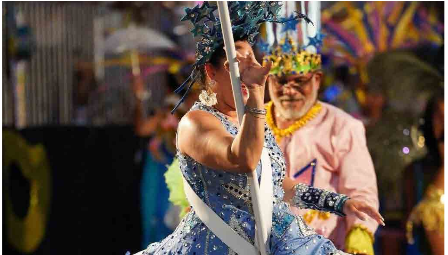
Lançada a programação do Carnaval 2025