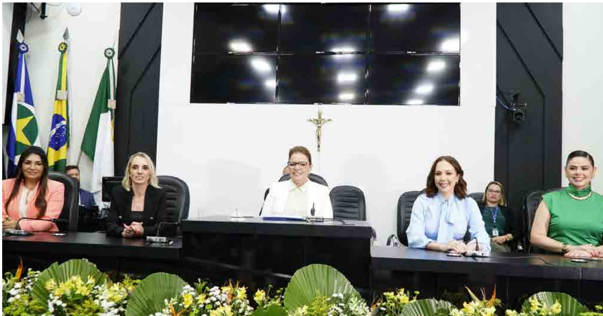
Presidente Paula Calil (PL) fez um panorama sobre o início do ano e o retorno das atividades

Janeiro de 2025 teve início com importantes mudanças e desafios para a Câmara de Cuiabá. Mesmo em recesso legislativo, os vereadores se dedicaram à análise e aprovação de projetos relevantes, a ampliação do diálogo com a sociedade e ao fortalecimento das políticas públicas.