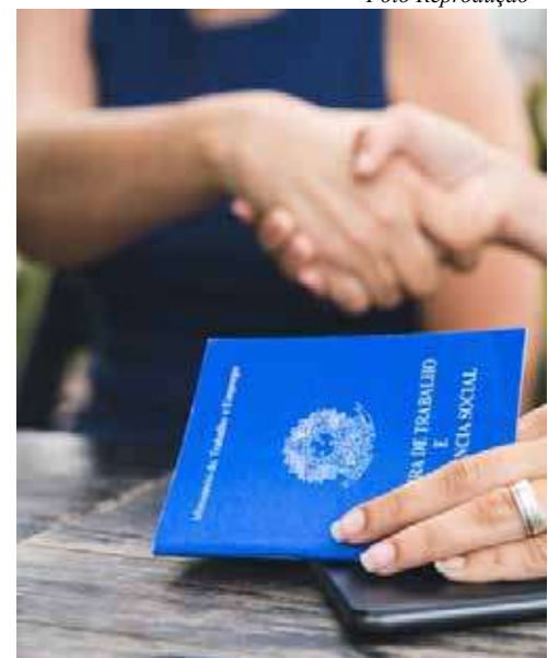
Em geral, o setor que mais gerou postos de trabalho foi o de serviços, com 10.979 novas vagas