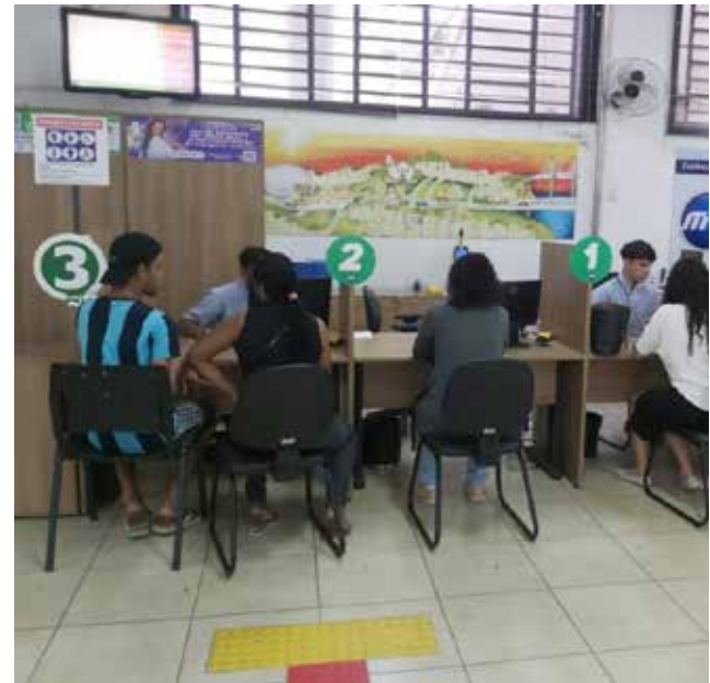
O benefício é assegurado por lei a todos os alunos matriculados na rede pública (municipal, estadual e federal) ou privada