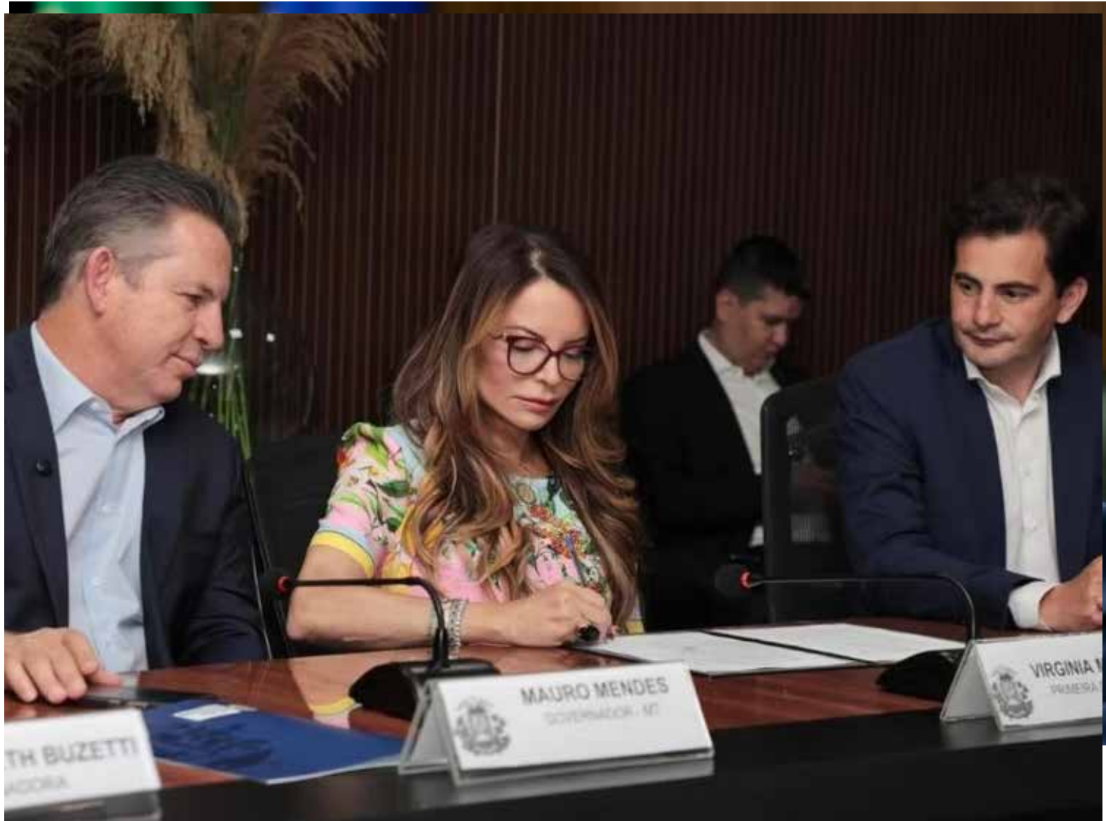
Idealizadora do programa SER Família Habitação, a primeira-dama Virginia Mendes destacou a importância do investimento na construção de moradias

Já o governador Mauro Mendes destacou as parcerias que possibilitam a construção das casas. "É muito importante e fundamental essa parceria que temos para encontrar os melhores caminhos e vencer os obstáculos. O apoio técnico da MT PAR, da Assistência Social, da Caixa