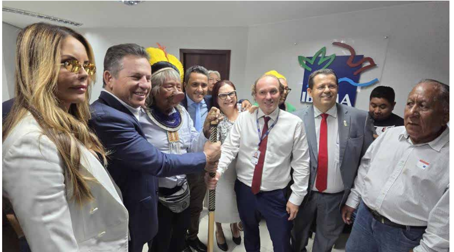
Primeira-dama, governador Mauro Mendes e o cacique Raoni Metuktire , entre apoiadores