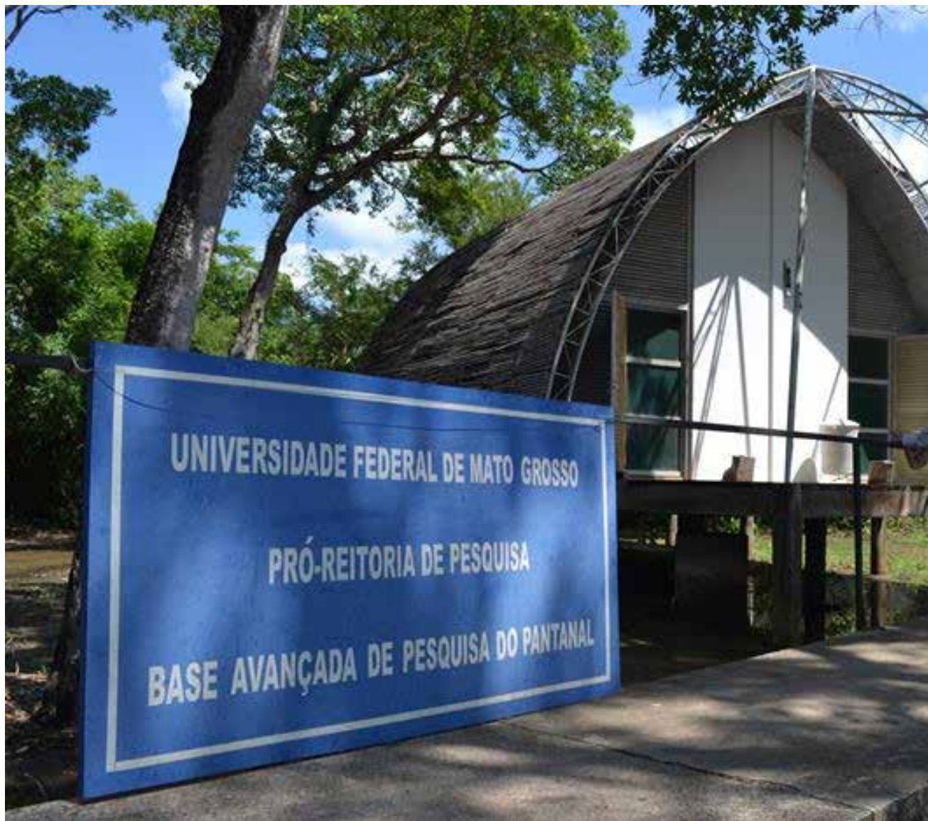
Inaugurada em maio de 2007, a estrutura ocupa uma área de 10 mil metros quadrados dentro do Parque SESC Baía das Pedras

social. Nos últimos anos, as unidades da UFMT mais atendidas pela base foram o Instituto de Biociências, o Instituto de Física, a Faculdade de Engenharia Florestal, Faculdade de Arquitetura, Engenharia e Tecnologia, a Faculdade de Veterinária, o Instituto de Ciências Naturais, Humanas e Sociais do Campus Universitário de Sinop; além disso, o Curso de Biologia da Universidade Federal de Rondonópolis (UFR) utiliza a estrutura. O Pró-reitor de Pesquisa