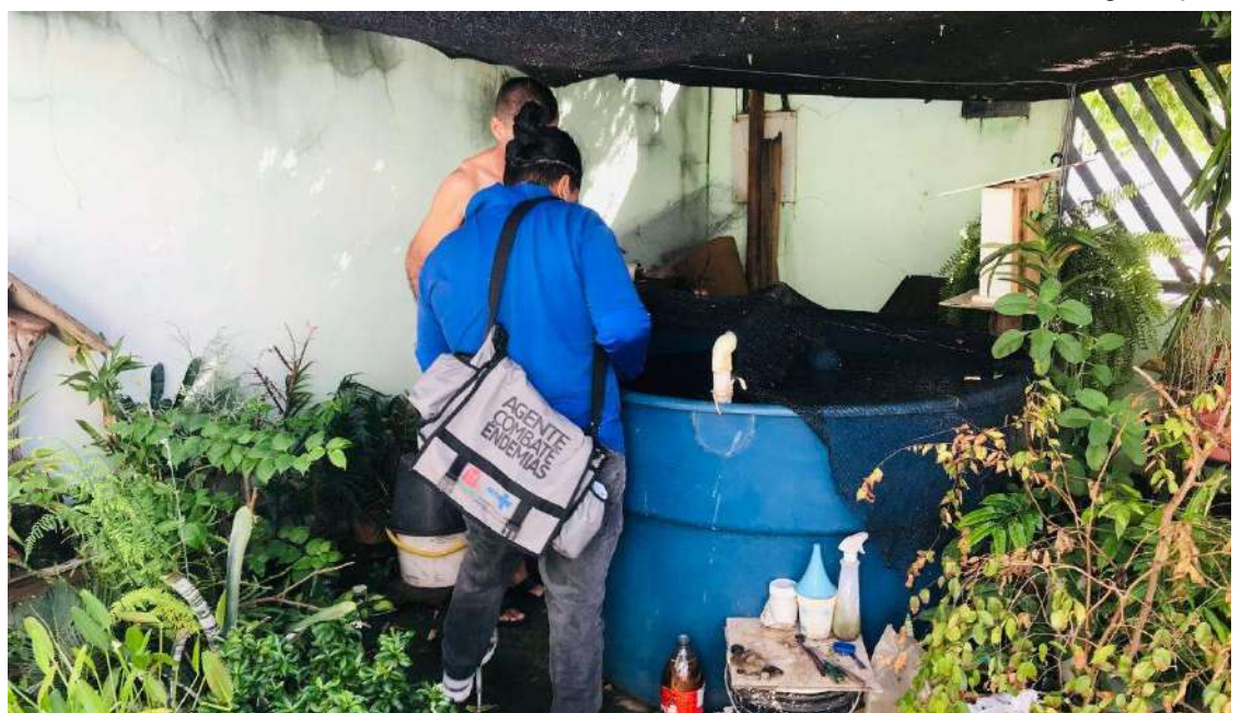
A secretária ainda pede o apoio dos munícipes de Várzea Grande para se conscientizem da importância de manter seus terrenos, quintais e jardins limpos, evitando água parada

A secretária ainda pede o apoio dos munícipes de Várzea Grande para se conscientizem da importância de manter seus terrenos, quintais e jardins limpos evitando água parada, “para que juntos possamos vencer a luta contra o mosquito Aedes aegypti”.