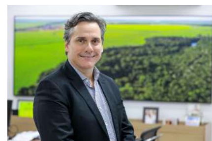
Rogério Gallo é secretário de Estado de Fazenda de MT