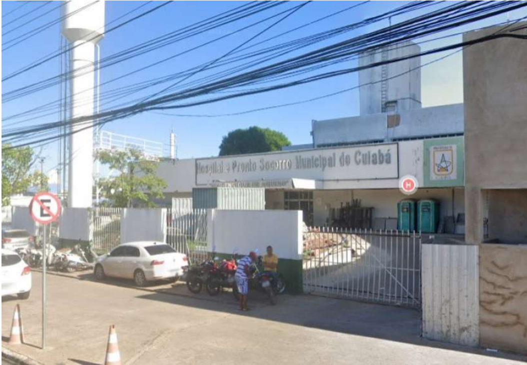
Novo Centro Médico Infantil vai funcionar no antigo Pronto-socorro de Cuiabá