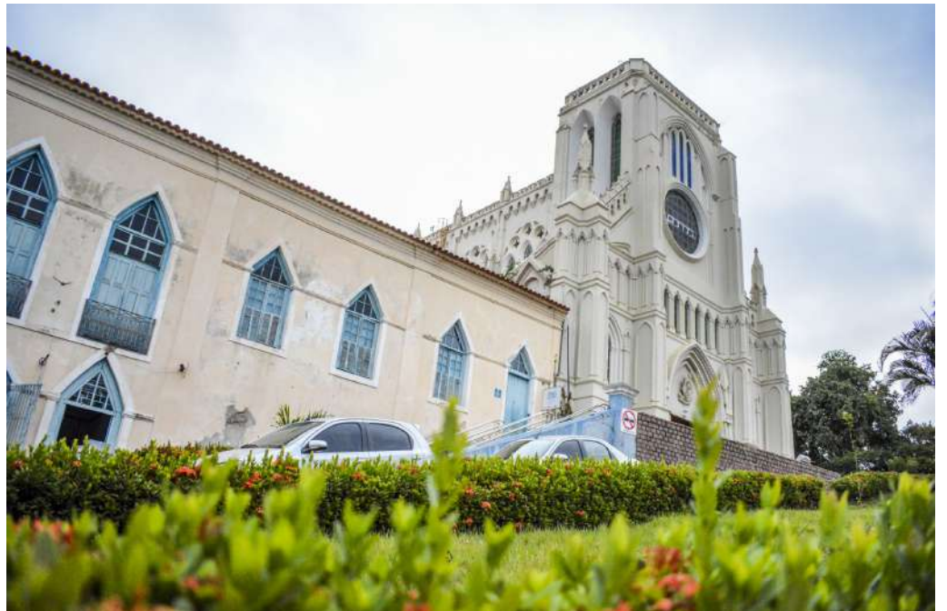
As datas para o mês de abril para o tour noturno ainda estão sendo definidas e em breve serão divulgadas

As datas para o mês de abril para o tour noturno ainda estão sendo definidas e em breve serão divulgadas. Por enquanto, as atividades continuam para quem já adquiriu os ingressos antecipados e as exposições estão abertas a visitação pública.