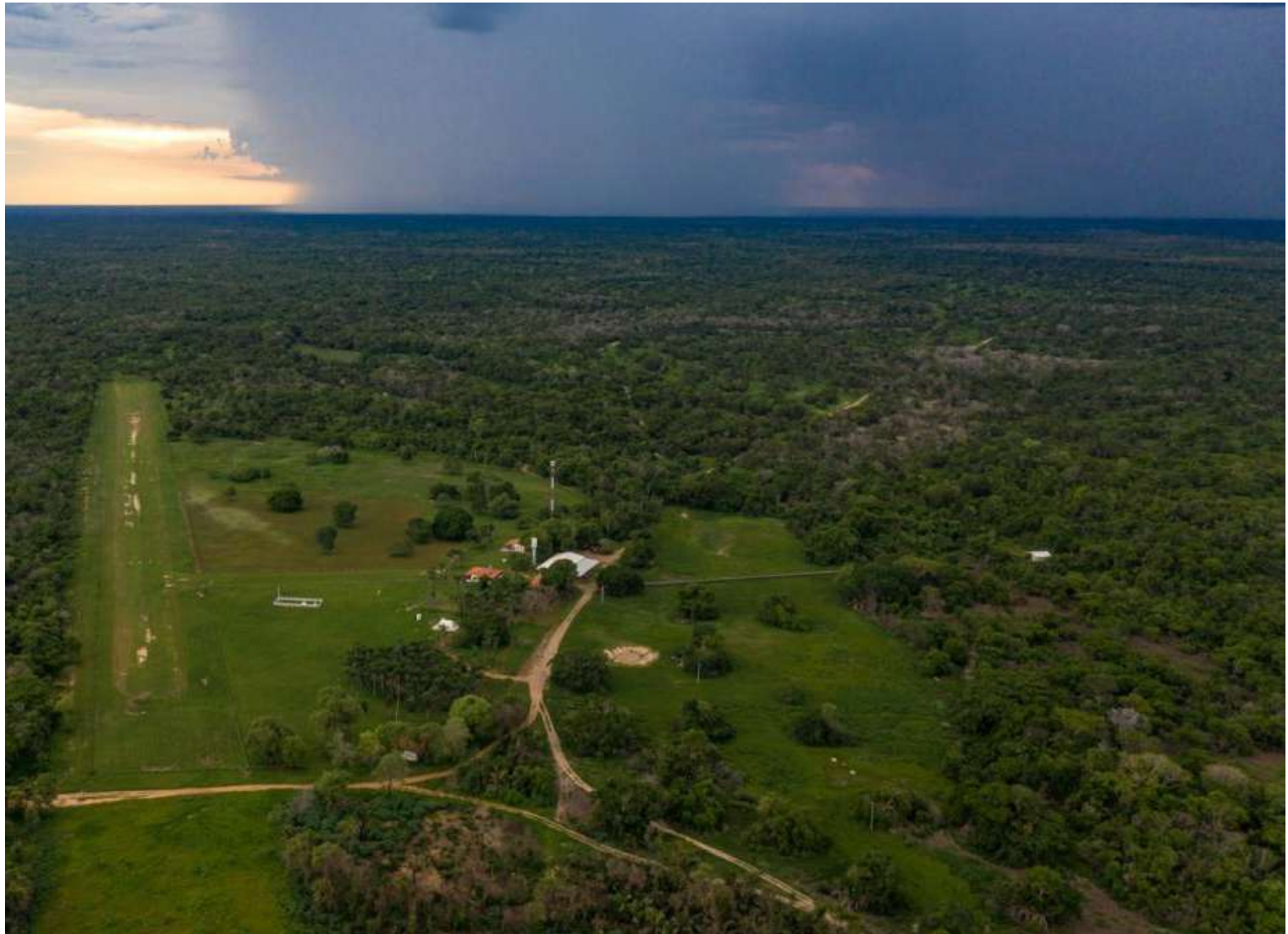
Somente na estação instalada na Reserva Particular do Patrimônio Natural (RPPN) Sesc Pantanal foram captados dois mil eventos nos últimos três anos

“Fazemos parte de uma importante rede de estações presentes em diferentes partes do mundo que ajudam a localizar um evento, como o ocorrido em Poconé (MT), recentemente. A RPPN tem centenas de pesquisas realizadas e o monitoramento contínuo de abalos sísmicos é uma delas, apoiando e desenvolvendo estudos científicos em parceria com diversas universidades”, explica. Monitoramento em todo o mundo A USP, por meio do Instituto e de seu Centro de Sismologia, monitora e estuda esses fenômenos que, embora geralmente não sejam motivo de preocupação, auxiliam na compreensão da dinâmica da Terra. Atualmente, o instituto opera diretamente 146 estações (uma delas na RPPN), cujos dados são integrados a outras redes de registros nacionais e internacionais.